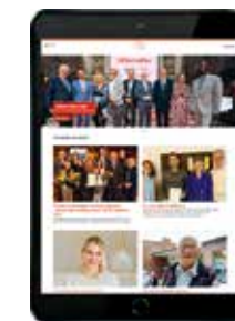
Besuchen Sie uns gern auf: haspa-hamburg-stiftung.de