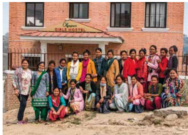
Das Girls Hostel: Dank der Option, in dem Neubau zu wohnen, konnten diese jungen Frauen eine Ausbildung absolvieren

Der Verein vermeldet erste Erfolge: Viele Frauen, die nach der Ausbildung in ihre Heimatdörfer zurückgekehrt sind, arbeiten in ihrem neuen Beruf und sorgen so selbst für ihren Lebensunterhalt.