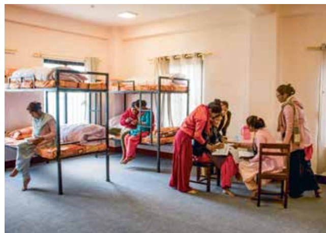
Ort der Begegnung und des Austauschs: Die durch Spenden finanzierte Unterkunft bietet 20 Bewohnerinnen ein temporäres Zuhause