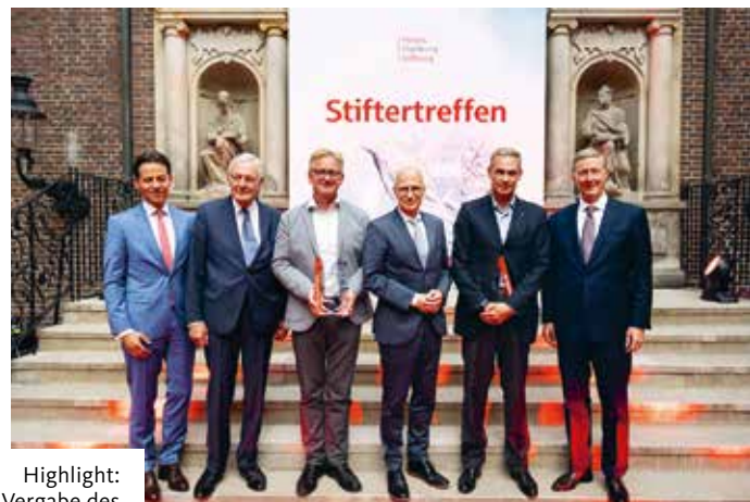
Highlight: die Vergabe des Karl-Joachim Dreyer-Preises