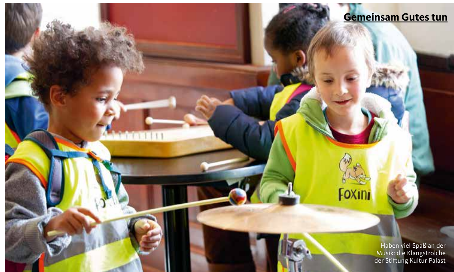
Haben viel Spaß an der Musik: die Klangstrolche der Stiftung Kultur Palast