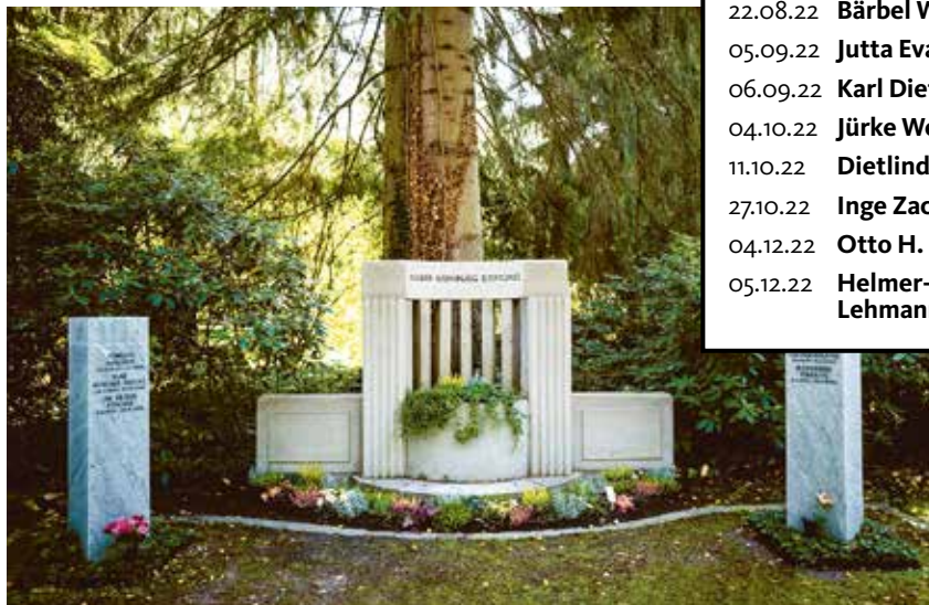
Die Grabstätte auf dem Friedhof Ohlsdorf: Schon fünf Stifter fanden hier ihre letzte Ruhe, und viele haben sich einen Platz reserviert