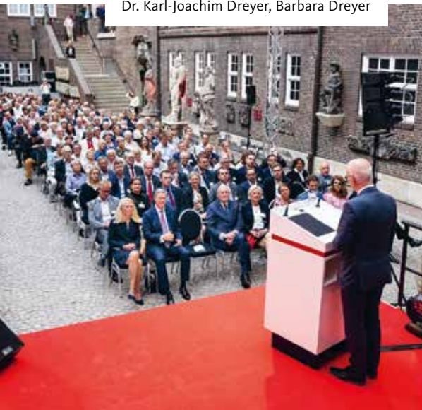
Dr. Peter Tschentscher bei seiner Rede (oben). Gute Gelegenheit: Der Marktplatz bot Raum für Austausch (unten)